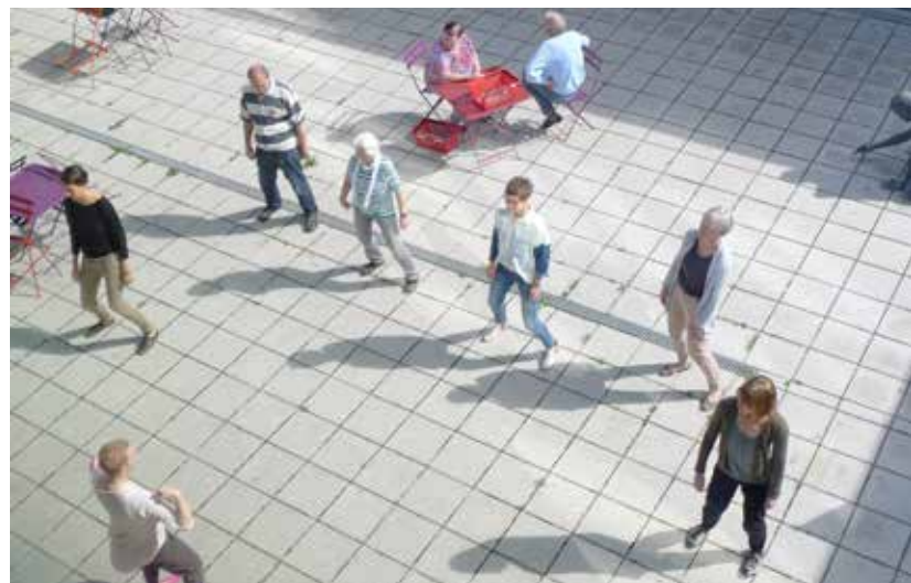
Tai Chi als Übung für Körper und Geist

Unsere Bibliotheken sind nicht nur bei schlechtem Wetter eine Konkurrenz für Berlins Parks und Gärten. Sowohl die BStB mit ihrem Lesehof als auch die AGB mit ihrer weitläufigen Wiese vor dem Haus laden ein zum Aufenthalt im Freien. Tai Chi als Übung für Körper und Geist schien uns der passende Start in einen Bibliothekstag und so boten wir den Sommer über zweimal wöchentlich Tai Chi an. Für das Mehr an Besucher*innen am Morgen wurde auch die Anzahl der meistgelesenen Tageszeitungen aufgestockt, damit die Morgenlektüre nicht warten muss.