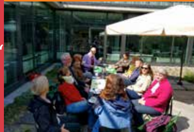
Shared Reading Gruppe im Hof der Berliner Stadtbibliothek

„Die Änderungen, die die Bibliothek gemacht hat, finde ich gut und richtig.“