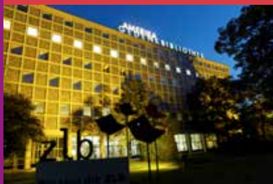
Schriftzug Amerika im Rahmen der Ausstellung PUBLIC LIBRARY