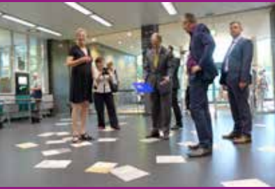
Ausstellung PUBLIC LIBRARY, Arbeit von Arnold Dreyblatt

„Ich möchte meinen großen Dank und meine Begeisterung ausdrücken für die Vielfalt der Medien.“